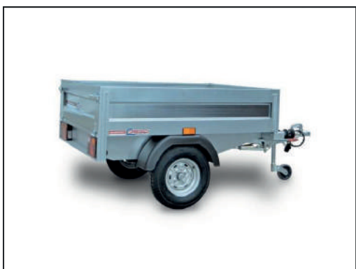
CRESCI B3 (Quad-Anhänger)