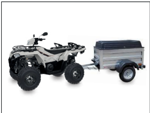
CRESCI H3 S.F. (Quad-Anhänger)