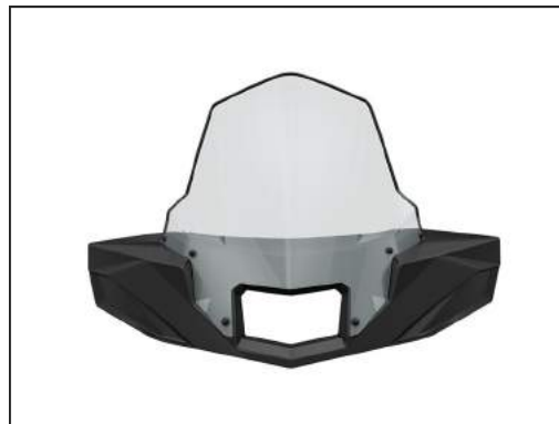
WINDSCHUTZSCHEIBE TALL VIEW [#2882152+2882512]