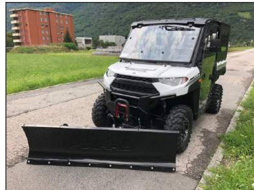
SCHNEESCHILD-KIT RANGER 1000