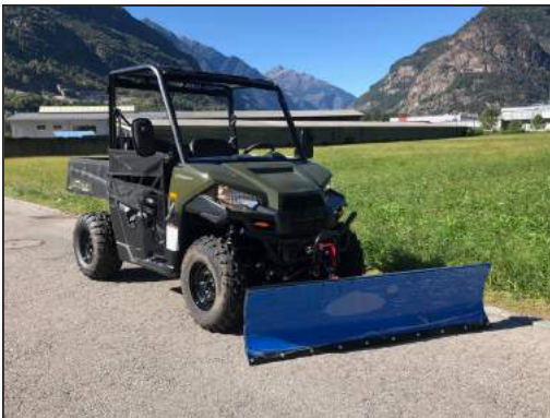
SCHNEESCHILD-KIT RANGER 570