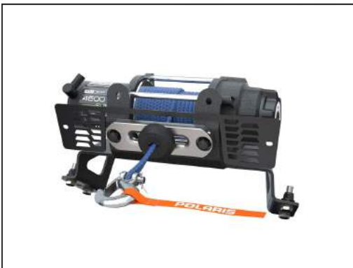
SEILWINDE PRO HD 4'500 LB [#2882238]