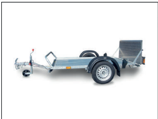
CRESCI PT4 S.F.