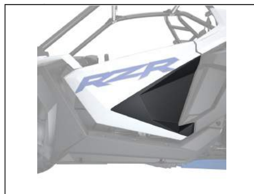
SEITLICHE TÜRVERRIEGELUNG [#2883765]