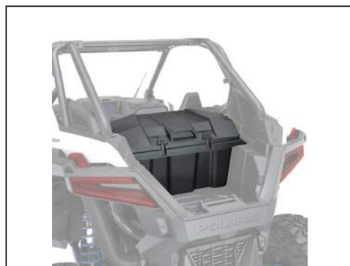
CARGO BOX HINTEN [#2883751]