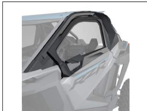
OBERE TÜREN CANVAS [#2884664]