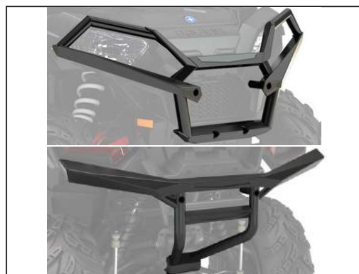
BUMPER VOR/HIN [#2882020/#2882583]