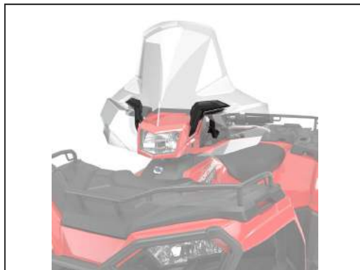
WINDSCHUTZSCHEIBE TALL VIEW [#2884945]