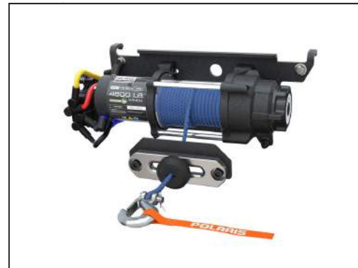
SEILWINDE PRO HD 4'500 LB [#2882711]