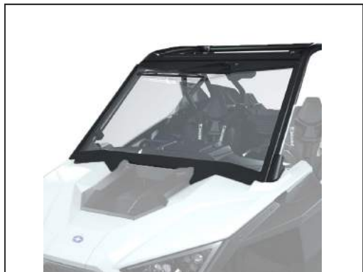
WINDSCHUTZSCHEIBE AUS GLAS [#2889019]