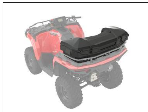
CARGO BOX HINTEN [#2884853]