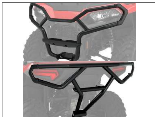
BUMPER VOR/HIN [#2884844/#2884847]